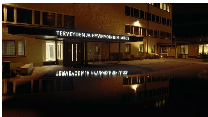
Terveyden ja hyvinvoinnin laitos THL 17.9.2020.